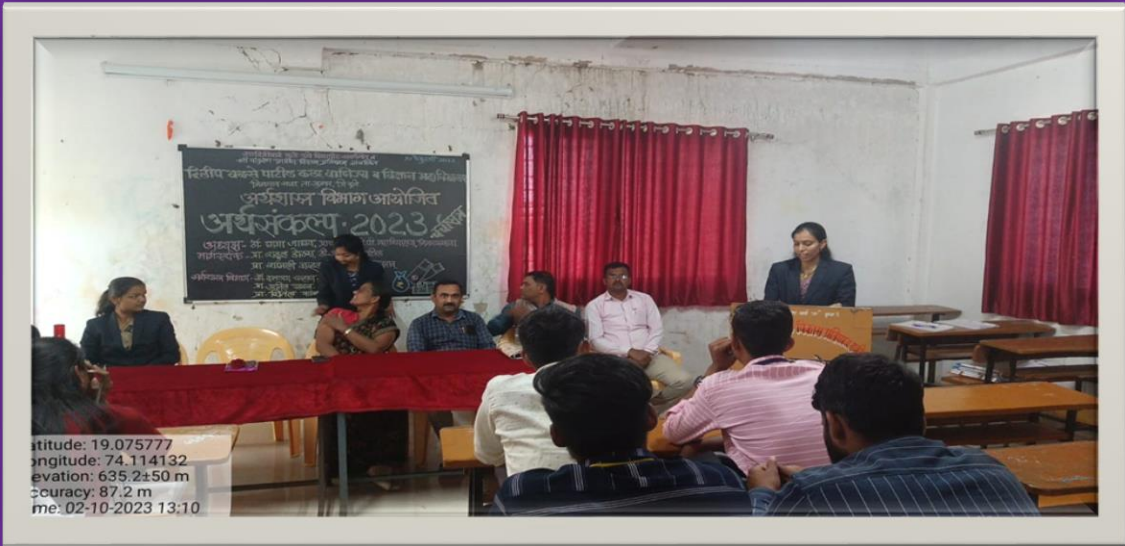
Aqa-saMkIp 2023 cacaa-sa~ maaga-dSa-na krtanaa p`a.Saamalal vaavhL.