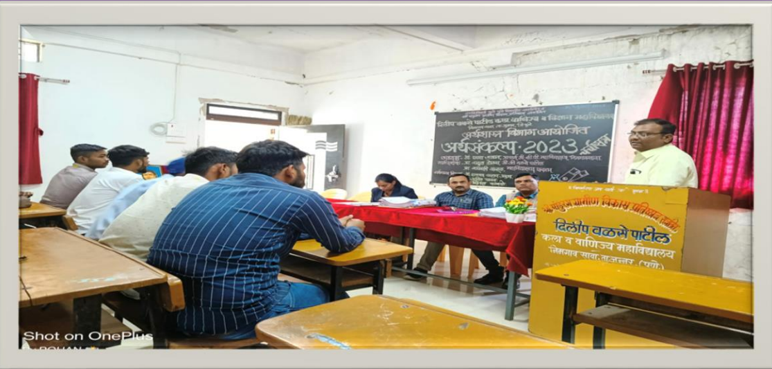
Aqa-saMklp 2023 cacaa-sa~ maaga-dSa-na krtanaa p`a.rahula DaoLsa.