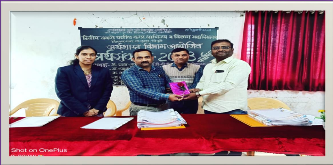
Aqa-saMklp 2023 cacaa-sa~ maanyavaraMcaa sanmaana krtanaa Da^.d%ta~ya cavhaNa