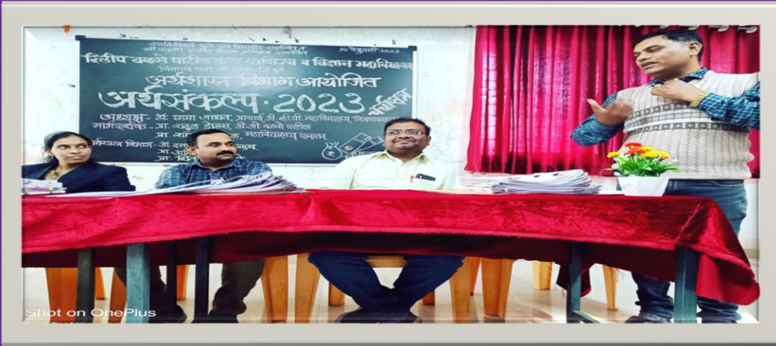
Aqa-saMklp 2023 cacaa-sa~ p`astaivak krtanaa p`a.Ainala pDval