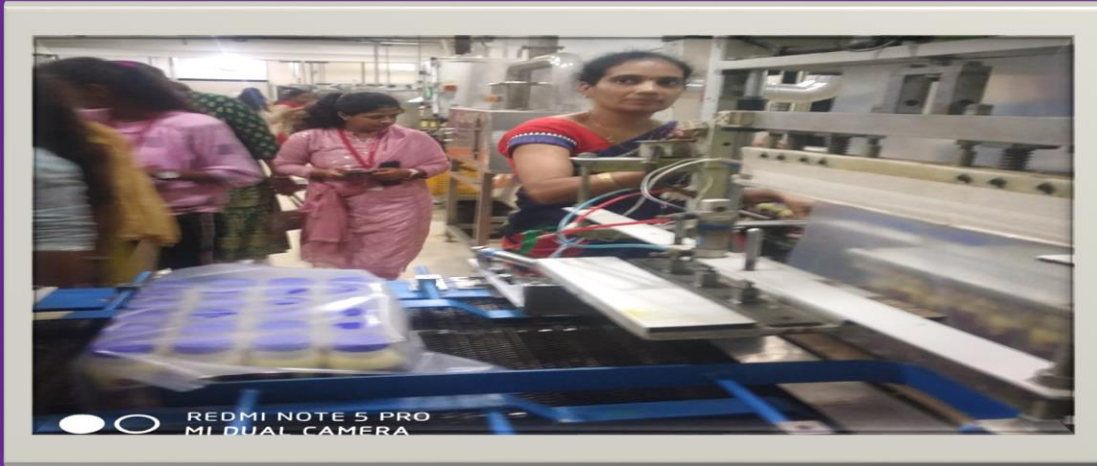
AakaSa DoAri fama- maMcar